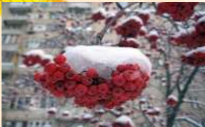
3, 4 рябина