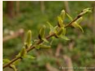
4, 3 цветла